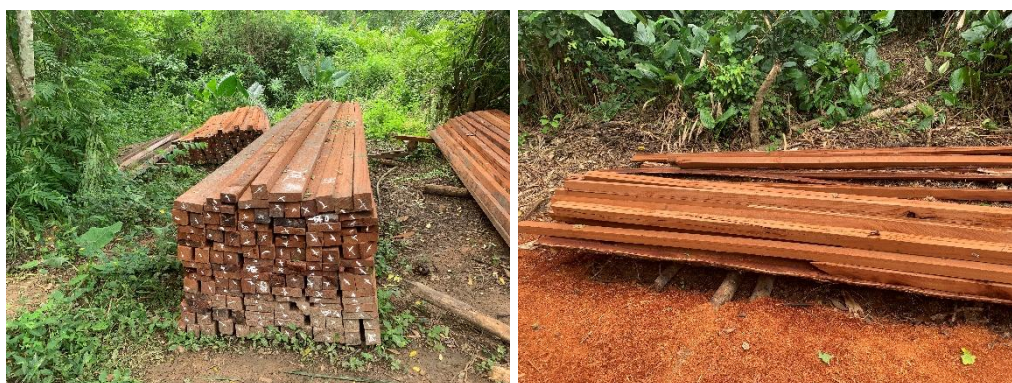
Figure 6 : Bois scié illégalement par madame Nnette et Rabihou