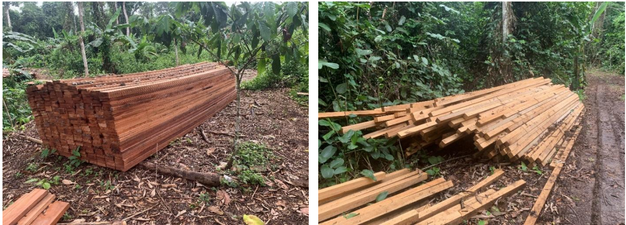
Figure 9 : Bois illégalement sciés par monsieur Regis AKOLI au village Bad