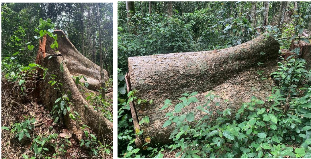
Figure 10 : Souche et culée des pieds illégalement abattus et évacués au village Zoulaboth