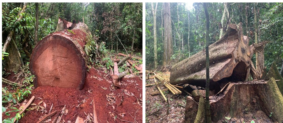
Figure 8 : Souche et fût illégalement abattus par monsieur Regis AKOLI au village Bad