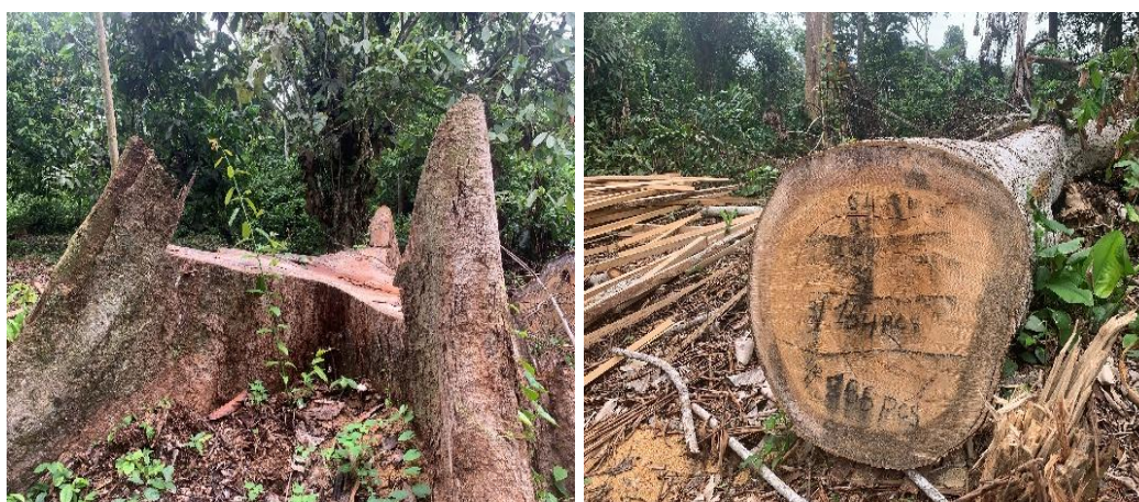
Figure 6 : Souche et bille illégalement abattu par Herman MOULOKI (village Bad)