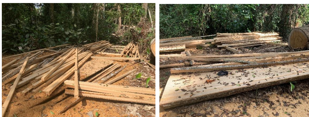
Figure 3 : Bois scié illégalement dans le village Démeyong par Mme Nenette