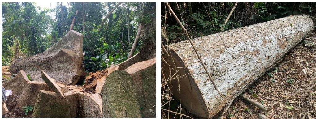
Figure 2 : Souche et bille illégalement exploités dans le village Démeyong par Mme Nenette