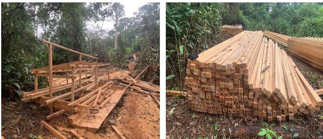
Figure 7 : Bois illégalement scié par Herman MOULOKI (village Bad)