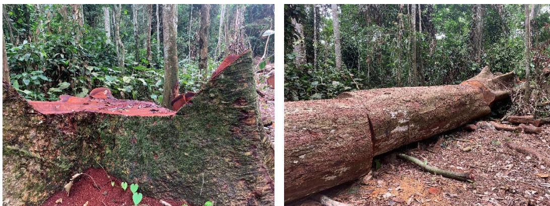
Figure 1 : Souche et billes illégalement exploités dans le village Biessé