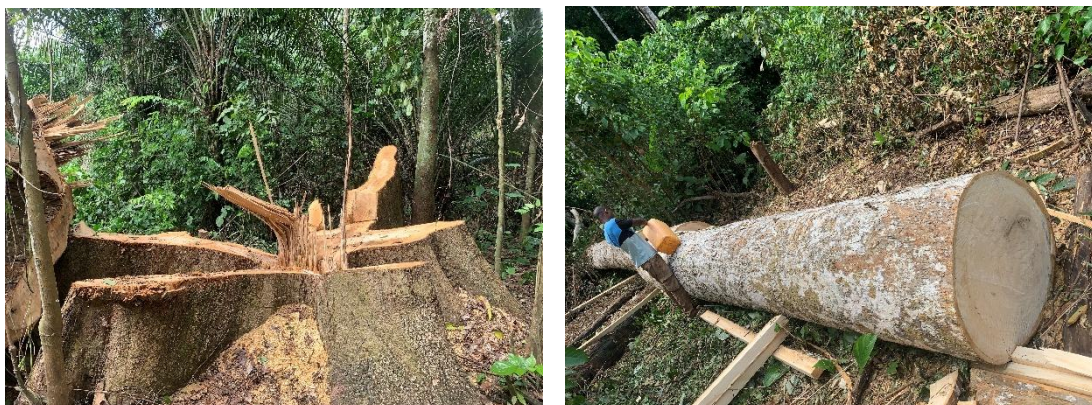
Figure 4 : Souche et billes illégalement abattus par la société la Fourmi