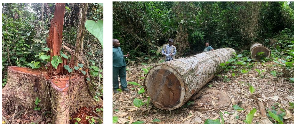
Figure 5 : Souche et bille illégalement abattus par madame Nnette et Rabihou