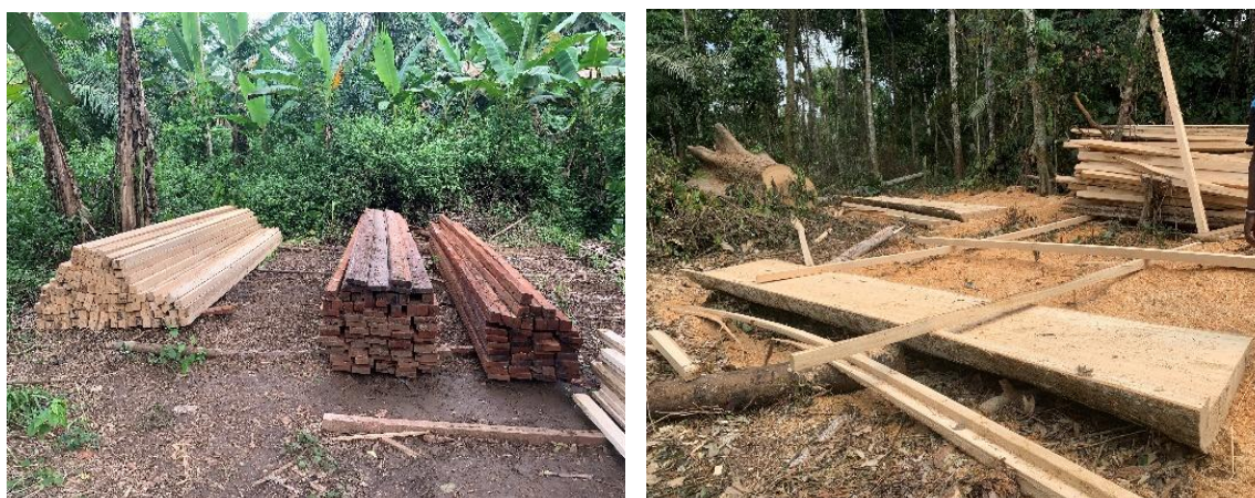
Figure 5 : Bois scié illégalement abattus par la société la Fourmi